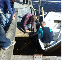
Överflödig kätting kapas