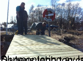
Dagen avslutas med en god middag, bryggarna är nöjda.